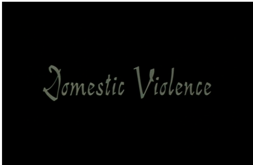
Photogramme de titre de Domestic Violence de Frederick Wiseman, 2001