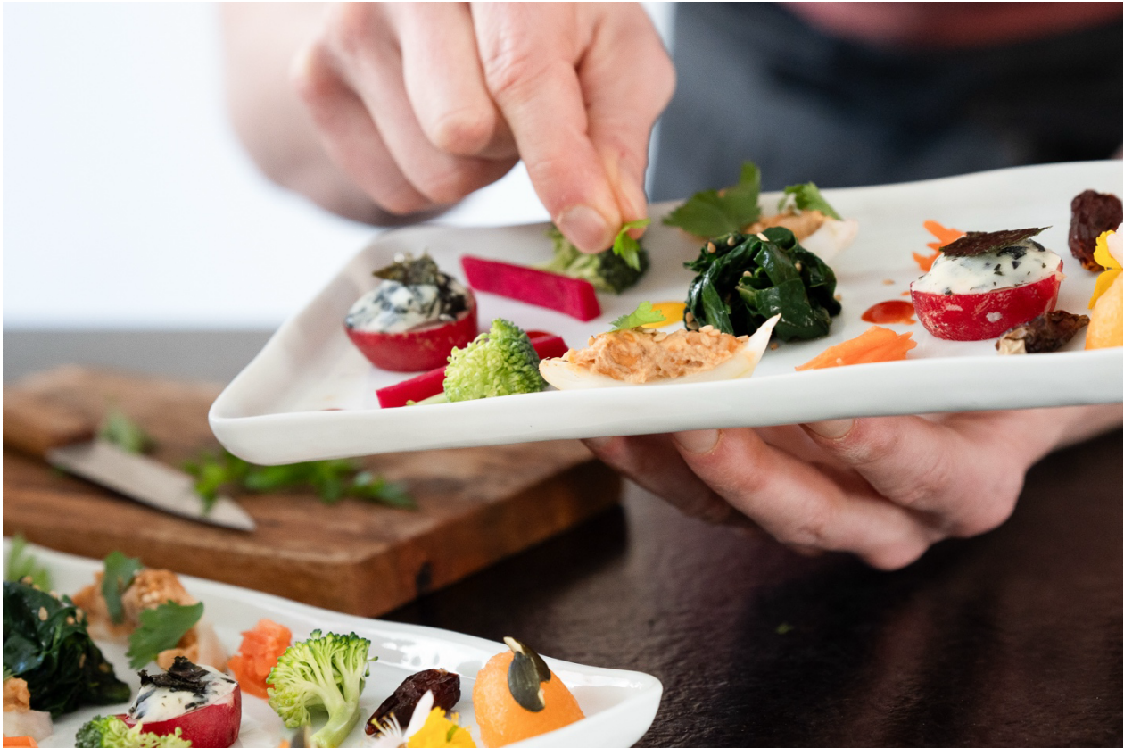
Essais d'assiettes