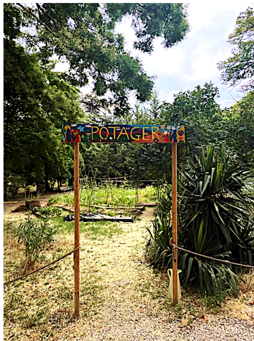
Photo de la Respéolid' / Jardins du Carmel d'Avignon, repérage juillet 2025

Tout comme Un dieu un animal , et porté par le même comédien, Martin Nikonoff, Un soupçon sera créé en milieu scolaire mais s'envisage dans tout type de contexte : théâtral, non-théâtral, mais aussi en plein air . En effet, la pièce trouverait tout son sens dans un environnement de jardin ou de potager. Pour la dernière bouchée, envisagée comme une invitation, l'interprète pourra proposer des herbes aromatiques cueillies au pied des convives . Ces herbes ayant poussé localement, je retrouve le facteur temps auquel se réfère le protagoniste.