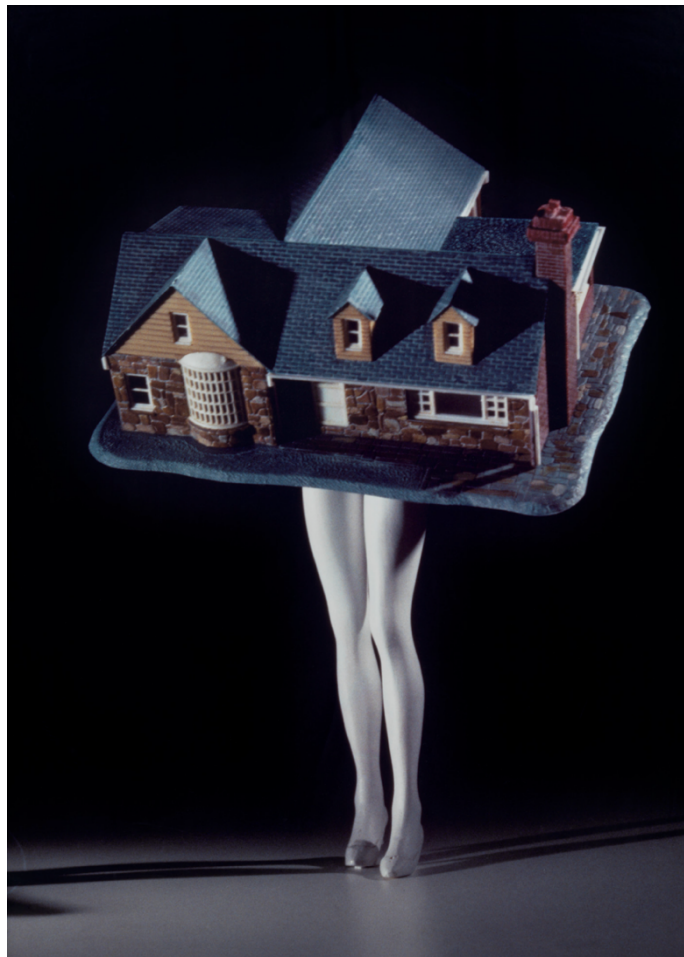
Laurie Simmons, Walking House , 1989