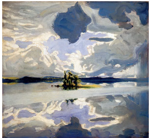
Akseli Gallen-Kallela, Nuages au-dessus d'un lac , 1904