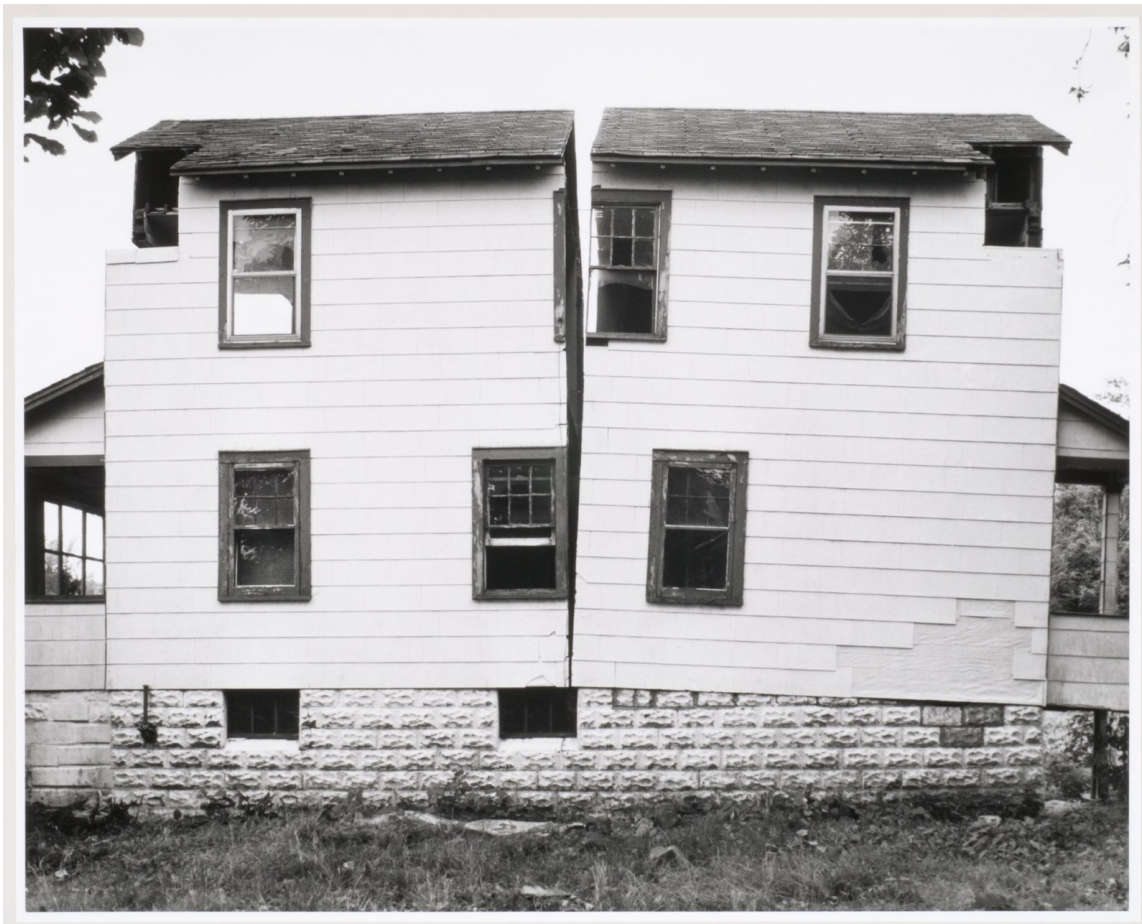
Gordon Matta-Clark, « Splitting », 1974