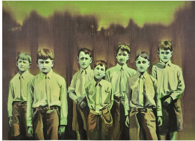
Claire Tabouret, L'Affront , 2013