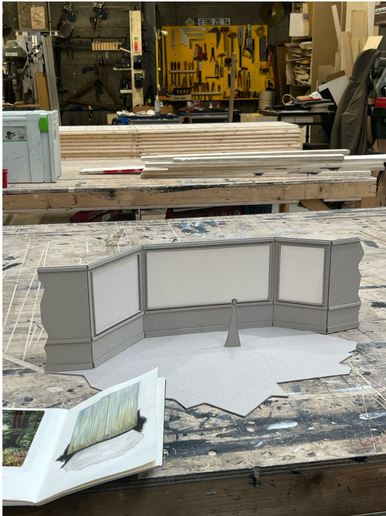
Maquette du décor - François Gauthier-Lafaye