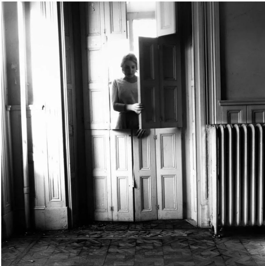
Francesca Woodman, Untitled , 1975-1978