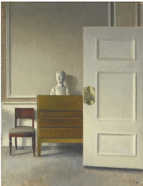
Vilhelm Hammershoi, Intérieur avec buste , 1900