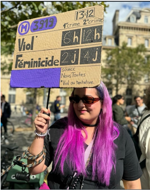
Manifestation du 14 septembre 2024 Paris, Instagram : Noustoutes.